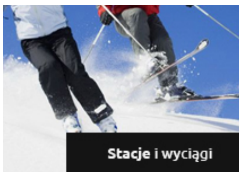
Stacje i wyciągi